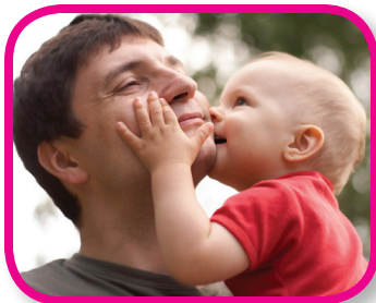
Con mucha suavidad De 18 a 24 meses