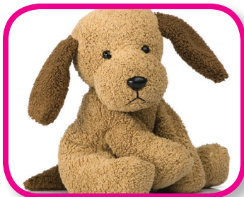
Ayúdame a saber De 18 a 36 meses