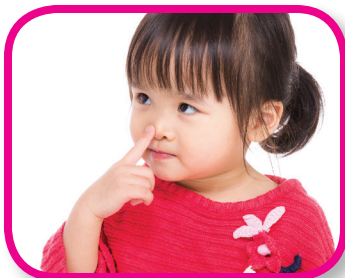
Tocar con un dedo De 18 a 36 meses