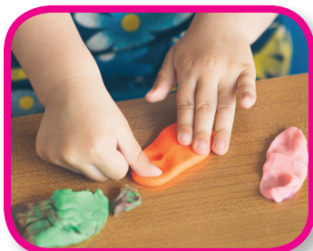
Opuestos De 24 a 36 meses